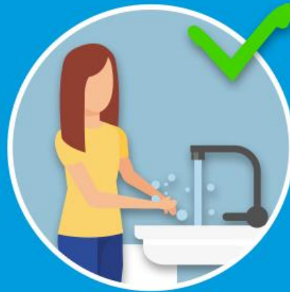
H = Hygiene (Händewaschen & Niesetikette)