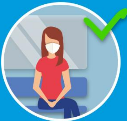
A = Alltagsmaske (FFP2 Standard)