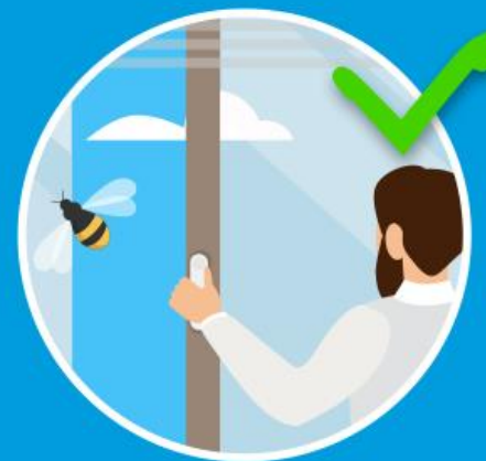
L = Lüften