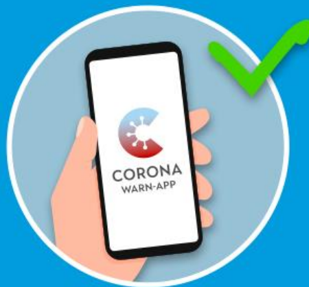
A = App (Corona-Warn-App)